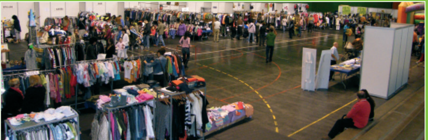
Hirugarren Stock Azoka, irailaren 26an Tercera edición de la Feria de Stock el pasado 26 de septiembre