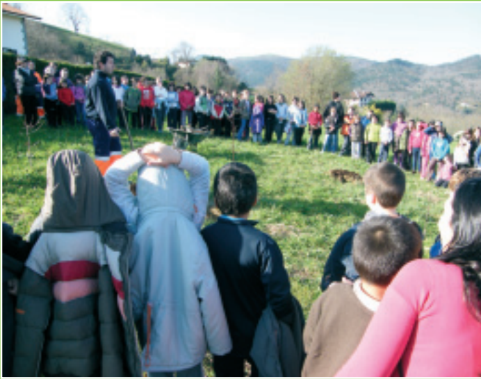
Ikasleekin Zuhaitz Eguna, aurreko martxoaren 9an Día del Árbol con los escolares, el pasado 9 de marzo