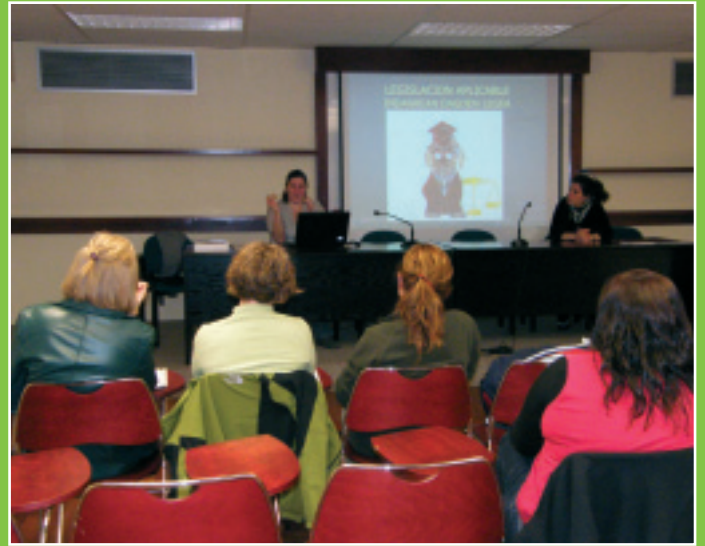
Lasartecan saioko hitzaldia indarrean dagoen legeriari buruz Charla sobre Legislación Aplicable del programa Lasartecan