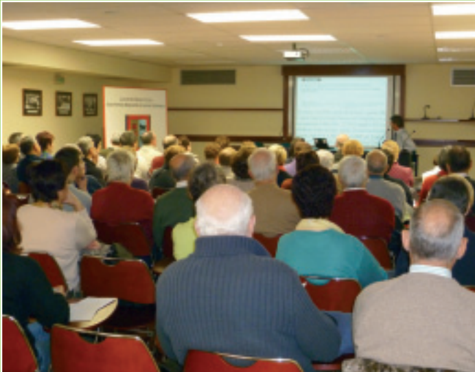
Gurutz Linazasoro, neurologo ezaguna, Alzheimerri buruzko hitzaldian XVIII Osasun Jardunaldietan El conocido neurólogo, Gurutz Linazasoro en la charla sobre Alzheimer dentro de las XVIII Jornadas de Salud